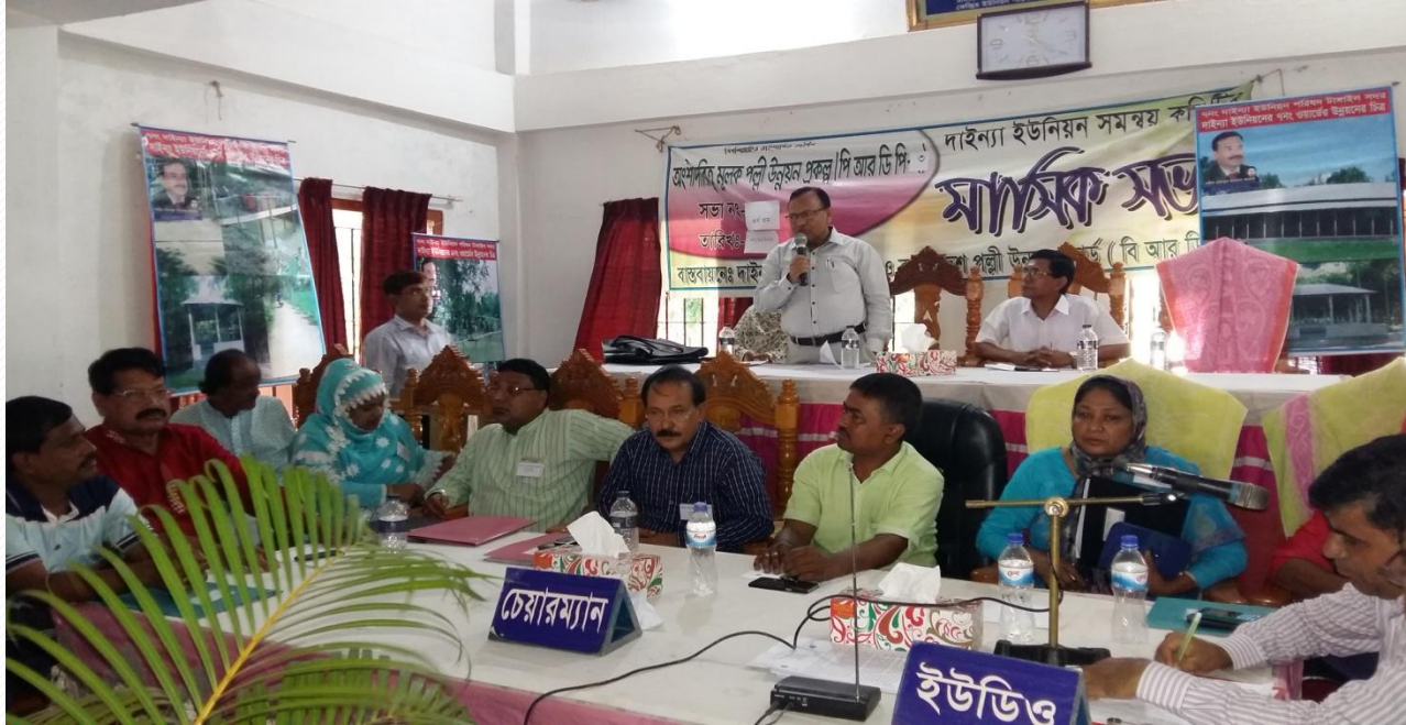
Union Coordination Committee Meeting (UCCM)

ইউনিয়ন কো-অর্ডিনেশন কমিটি মিটিং হচ্ছে ইউনিয়ন পর্যায়ে ইউপি সদস্য, সরকারী/বেসরকারী কর্মকর্তা/কর্মচারী এবং গ্রামবাসীগণ কর্তৃক তথ্য বিনিময় করা ও জবাবদিহিতা নিশ্চিত করার একটি অন্যতম ফোরাম, যা ‘মিনি পার্লামেন্ট’ হিসেবে বিবেচিত।